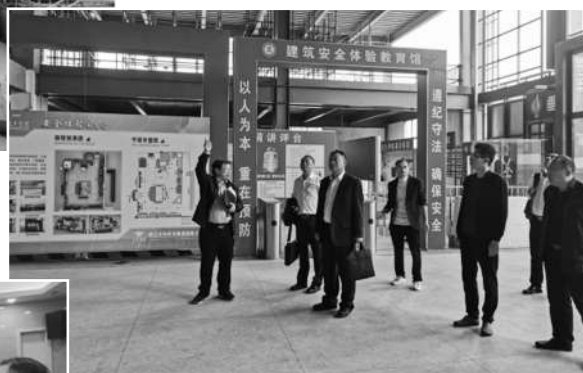
江西建设职业技术学院实训基地里的建筑安全体验馆