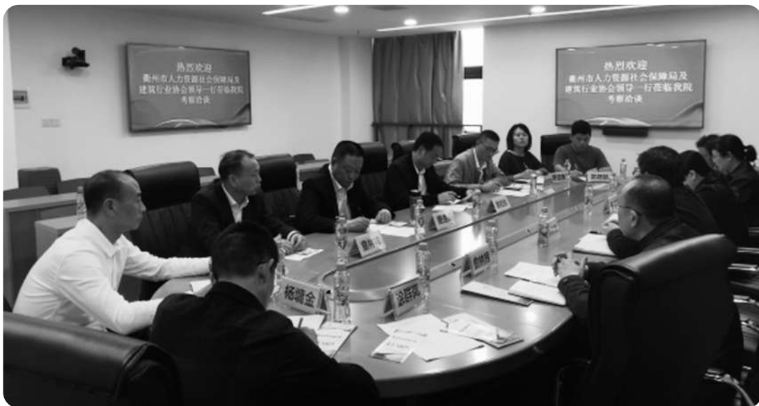
与江西建设职业技术学院校方领导座谈交流

4月22-23日市建协一行赴江西南昌、新余两地,考察对接了江西建设职业技术学院及江西工程学院两所高校,为下一步组织衢州优质企业赴高校引进大学生做好铺垫。此次活动获得衢州市人力资源社会保障局的大力支持,在衢州建园人力资源开发有限公司的配合下,圆满完成预定的目标。