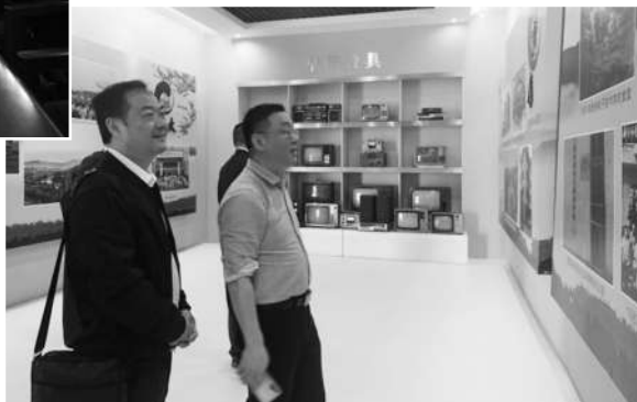
参观江西工程学院校史馆