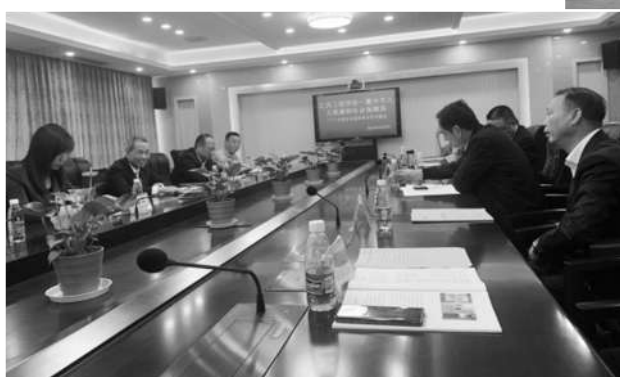
与江西工程学院校方领导座谈交流