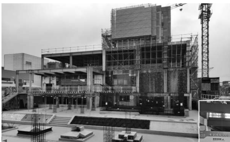
江西建设职业技术学院实训基地就是“在建工地”

2. 江西工程学院:在校学生达到 18000 多人,设有土木工程学院,目前开设有土木工程、工程造价 2 个本科专业,工程造价、建筑工程技术、道路桥梁工程技术 3 个专科专业。现有在校生 1500 余人,每年毕业生 450 多人。生源为江西省内为主,也有全国各地生源。